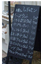
お菓子のアンセルセン